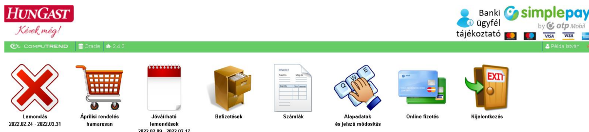
2. kép: Főmenü

A főmenübe lépteti a rendszer sikeres bejelentkezés után.