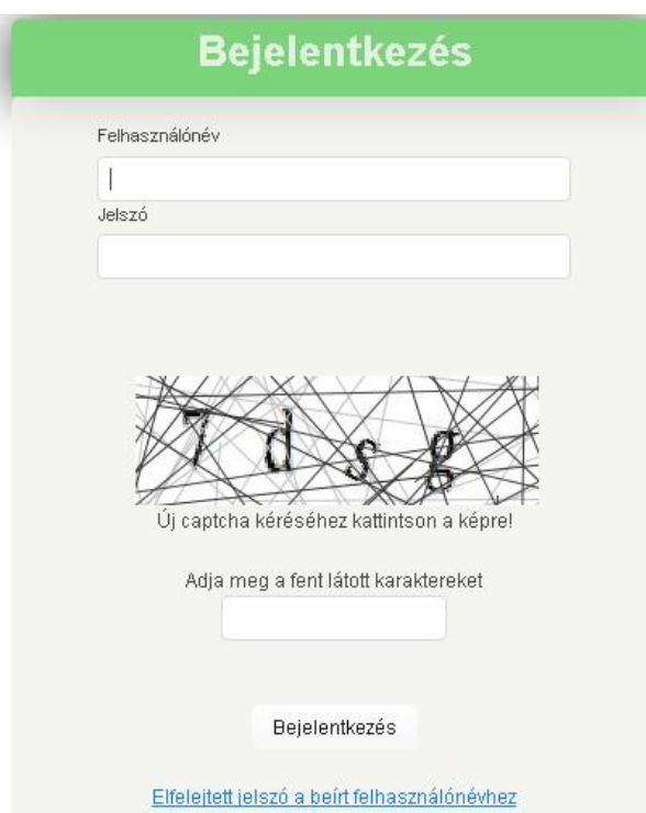
1. kép: Bejelentkezési képernyő

A szülői felületet a https://gyakorlo2.hungast.hu/ internetes címen érik el. Az 1. ábra mutatja a bejelentkezési képernyőt, ahol meg kell adni a korábban megkapott felhasználónevet és jelszót, illetve a captcha kódot, majd a Bejelentkezés gombra kattintva lehet belépni.