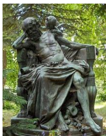
Anakreón 5 -szobor Jókai Mór arcával a Jókai-kertben

Jókai Mór 28 évesen az Egy magyar nábob és a Kárpáthy Zoltán c. regényeinek honoráriumából 2 vásárolta meg 2200 forintért az akkor kőbányának használt kétholdas 3 földet, ahonnan pazar kilátás nyílt a Gellérthegyre, a Dunára és a városra. Hárs-, juhar-, vadgesztenye- és diófákat ültetett, hogy felfogják az északi szelet. Teraszosan alakította ki a kertet, feltöltötte termőfölddel, gyümölcsfákat és szőlőt telepített, konyhakertet 4 létesített, rózsákat nemesített. Ide vonult el pihenni és írni a város zajától.